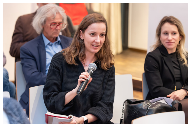
Diskussionen zur Rolle von Ernährung als zentralem Bestandteil von Prävention und Therapie sowie zu neuen wissenschaftlichen Erkenntnissen in der innovativen Medizin.