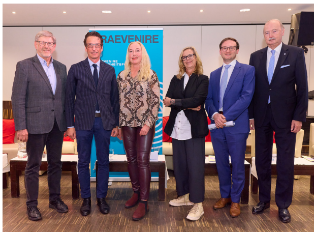
Vortragende zu medizinisch-wissenschaftlichen Themen der Frauengesundheit.

Darüber hinaus wurde deutlich, dass Frauengesundheit immer auch eine soziale Frage ist. Faktoren wie finanzielle Sicherheit, Sorgearbeit und gesellschaftliche Rollenbilder haben erheblichen Einfluss auf die gesundheitliche Situation von Frauen. Diese Zusammenhänge müssen stärker berücksichtigt werden, um gezielte Maßnahmen entwickeln zu können.