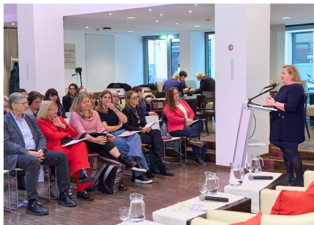
Gesundheitsministerin Korinna Schumann bei ihrem Vortrag zur Frauengesundheit.

Ein weiterer zentraler Aspekt war die Bedeutung von Forschung und Gendermedizin. Historisch bedingt besteht insbesondere bei frauenspezifischen Gesundheitsdaten ein großer Nachholbedarf. Gleichzeitig zeigen sich deutliche Unterschiede in Krankheitsverläufen, Symptomen und Therapieansprechen zwischen Frauen und Männern. Daher wurde gefordert, Genderkompetenz stärker in Ausbildung und medizinische Praxis zu integrieren sowie Forschungsergebnisse konsequent umzusetzen.