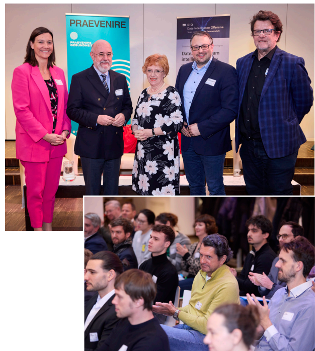
Diskussionen zum European Health Data Space (EHDS) als Grundlage für eine sichere, vernetzte und datengetriebene Gesundheitsversorgung der Zukunft.

Abschließend wurde deutlich, dass der EHDS als langfristige Transformationsaufgabe verstanden werden muss. Während der rechtliche Rahmen bereits gesetzt ist, wird sich der Erfolg in der praktischen Umsetzung der kommenden Jahre entscheiden. Transparente Kommunikation, verständliche Nutzenbilder und eine konsequente Einbindung der Bevölkerung werden dabei zentrale Hebel sein, um Vertrauen aufzubauen und den Wandel nachhaltig zu verankern.