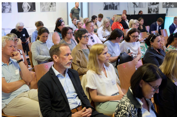
Die Veranstaltung brachte Fachleute zum gemeinsamen Austausch zusammen.

Der zweite Veranstaltungstag rückte politische und strukturelle Fragen in den Vordergrund. In einer hochkarätig besetzten Podiumsdiskussion wurde Einigkeit darüber erzielt, dass Kinder- und Jugendgesundheit als gesamtgesellschaftlicher Auftrag verstanden werden muss. Neben der Stärkung psychischer Gesundheit wurden insbesondere der Ausbau regionaler Versorgungsnetzwerke, die Förderung von Prävention sowie die bessere Vernetzung bestehender Systeme hervorgehoben. Auch die Digitalisierung wurde als wichtiger Hebel gesehen – etwa durch den elektronischen Eltern-Kind-Pass und die bessere Nutzung von Gesundheitsdaten.