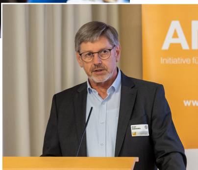
Austausch und Diskussionen zur Weiterentwicklung einer modernen, wohnortnahen Gesundheitsversorgung in Österreich.