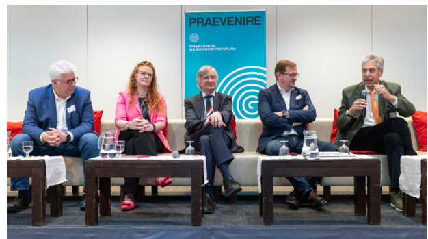
Podiumsdiskussion zu Reformen im Gesundheitssystem.