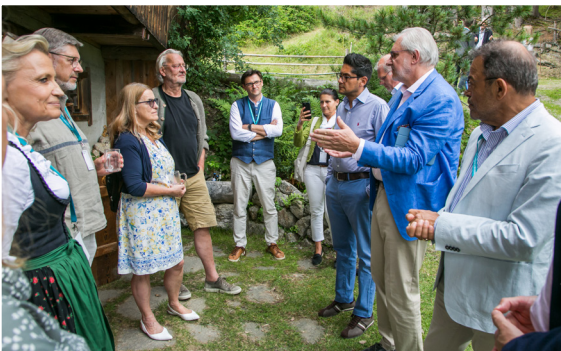
Teilnehmende der 12. PRAEVENIRE Gesundheitsgespräche in Alpbach beim Austausch im Rahmen des vielfältigen Programms, das zentrale Fragen der zukünftigen Gesundheitsversorgung und aktuelle medizinische Entwicklungen in den Mittelpunkt stellte.