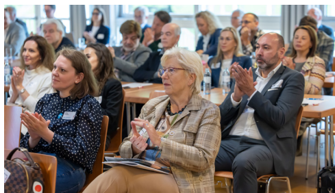
Der 2. PRAEVENIRE Denkertag brachte Expertinnen und Experten zur Zukunft des Gesundheitssystems zusammen.

Der 2. PRAEVENIRE Denkertag machte damit deutlich, dass die Zukunft des Gesundheitssystems nicht an einer einzelnen Maßnahme hängt, sondern an der Fähigkeit, Finanzierung, Prävention, Versorgung und Digitalisierung gemeinsam zu denken. Gerade darin lag die Stärke des Formats: unterschiedliche Perspektiven nicht nebeneinanderstehen zu lassen, sondern daraus konkrete, anschlussfähige Lösungsansätze für ein solidarisches und zukunftsfittes Gesundheitssystem zu entwickeln.